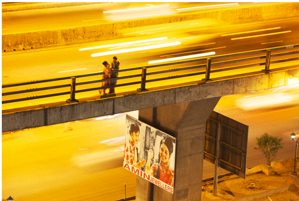
Lovers Lane, reclamebord onder Mohakhali Flyover, Dhaka, Bangladesh

Maak een wandeling. Fotografeer onder het wandelen de dingen waarop je oog valt. Een detail trekt je aandacht, doet er niet toe wat. Vraag je niet af waarom. Verzamel rustig door, later rijgen je foto's zich als vanzelf aaneen als de kralen in een ketting. Zo ontstaat een verhaal dat je nog niet kent.