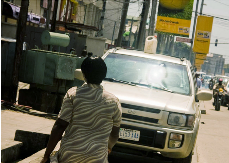
Auto te koop in Lagos, Nigeria